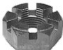
MAQUINADA AUTOS PICK UP FORD

H34-112 THREAD ROSCA 3/4-16H HEX HEXAGONO: 1 1/4" HEIGHT ALTURA: 9/16" TROPICALIZADA U/E 150