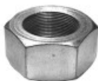
MAQUINADA TSURU I 1984/87

°2 THREAD ROSCA 22X1 HEX HEXAGONO: 31 MM HEIGHT ALTURA: 19 MM TROPICALIZADA U/E 75