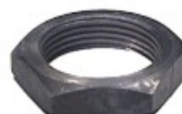
MAQUINADA EJE SUDISA

THREAD "2 ROSCA 1 3/4-12H HEX HEXAGONO: 2 1/4" HEIGHT ALTURA: 7/16" PAVONADA U/E 50