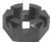
MAQUINADA CAMION FORD 600

THREAD "2 ROSCA 1"-14H HEX HEXAGONO: 1 1/2" HEIGHT ALTURA: 5/8" TROPICALIZADA U/E 75