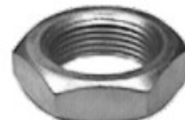
MAQUINADA MAVERICK FAIRMONT PLANA

H34-105 THREAD ROSCA 13/16-20H HEX HEXAGONO: 1 1/8" HEIGHT ALTURA: 5/16" TROPICALIZADA U/E 250