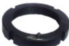
MAQUINADA DODGE CHEVROLET FORD DOBLE TRACCION

THREAD "2 ROSCA 1 5/8-16H HEX HEXAGONO: N/A HEIGHT ALTURA: 0/0" PAVONADA U/E 50