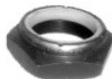
MAQUINADA C-60 INSERTO NYLON

THREAD "2 ROSCA 1 1/8-18H HEX HEXAGONO: 1 5/8" PAVONADA U/E 50