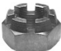
MAQUINADA C-30 RODADO DOBLE/SENCILLO

H34-115 THREAD ROSCA 27/32-20H HEX HEXAGONO: 1 1/4" HEIGHT ALTURA: 53/64" TROPICALIZADA U/E 75