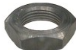
MAQUINADA CAMION DINA 600 CONTRATUERCA

THREAD "2 ROSCA 1 1/2-12H HEX HEXAGONO: 2 1/4" HEIGHT ALTURA: 7/16" PAVONADA U/E 30