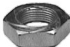
MAQUINADA DODGE D-100 PICK UP, AUTOS PLANA

H34-104 THREAD ROSCA 3/4-16H HEX HEXAGONO: 21/64" HEIGHT ALTURA: 0/0" TROPICALIZADA U/E 300