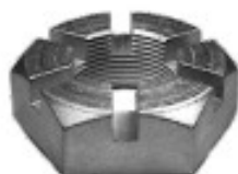
MAQUINADA CAMION FORD 5,500 LBS

THREAD "2 ROSCA 1 1/4-18H HEX HEXAGONO: 2 1/4" HEIGHT ALTURA: 21/32" TROPICALIZADA U/E 75