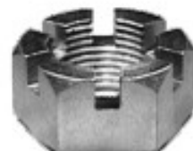
MAQUINADA DODGE D-600

THREAD "2 ROSCA 1 1/8-12H HEX HEXAGONO: 1 5/8" HEIGHT ALTURA: 53/64" TROPICALIZADA U/E 50