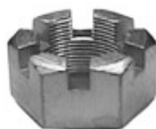
MAQUINADA AUTOS DODGE VALIANT 1960/64

H34-122 THREAD ROSCA 11/16-24H HEX HEXAGONO: 1" HEIGHT ALTURA: 9/16" TROPICALIZADA U/E 150