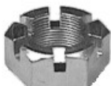
MAQUINADA DODGE D-600

THREAD "2 ROSCA 1 1/8-18H HEX HEXAGONO: 1 5/8" HEIGHT ALTURA: 3/4" TROPICALIZADA U/E 50