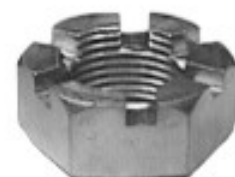
MAQUINADA F-100 PICK UP AUTOS FORD

H34-111 THREAD ROSCA 3/4-16H HEX HEXAGONO: 1 1/16" HEIGHT ALTURA: 5/8" TROPICALIZADA U/E 250