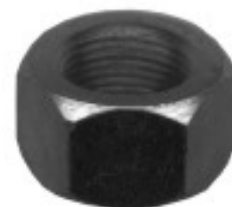
MAQUINADA FORD TOPAZ VW

°2 THREAD ROSCA 22X1.50 HEX HEXAGONO: 31 MM HEIGHT ALTURA: 18 MM PAVONADA U/E 100