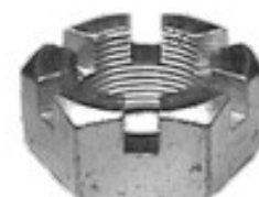
MAQUINADA C-30, IMPALA CAPRICE RODADO DOBLE/SENCILLO

H34-123 THREAD ROSCA 27/32-20H HEX HEXAGONO: 1 1/4" HEIGHT ALTURA: 37/64" TROPICALIZADA U/E 150