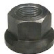
MAQUINADA NISSAN TSURU II CAMPANA

°2 THREAD ROSCA 22X1.50 HEX HEXAGONO: 30 MM HEIGHT ALTURA: 22 MM TROPICALIZADA U/E 75