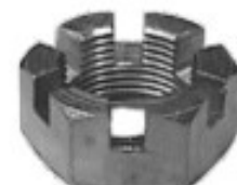
MAQUINADA CHEVROLET PICK UP AUTOS

H34-110 THREAD ROSCA 3/4-20H HEX HEXAGONO: 1 1/16" HEIGHT ALTURA: 33/64" TROPICALIZADA U/E 250