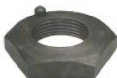
MAQUINADA CAMION DINA 600 CON PERNO

THREAD "2 ROSCA 1 1/2-12H HEX HEXAGONO: 2 1/2" HEIGHT ALTURA: 7/16" PAVONADA U/E 30