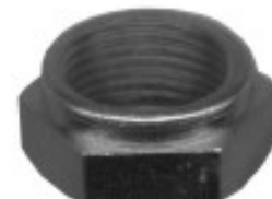
MAQUINADA PRESION ESPIGA

H34-138 THREAD ROSCA 7/8-16H HEX HEXAGONO: 1 1/8" HEIGHT ALTURA: 1/2" TERMINADO 2? U/E 20