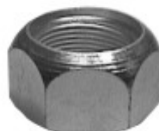
FORJADA PARA CAPUCHON

H16-357 H16-358L THREAD °5 ROSCA 1 1/8-16H HEX HEXAGONO: 1 1/4" HEIGHT ALTURA: 1" PAVONADA U/E 75