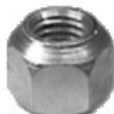
MAQUINADA DODGE RAMBLER WILLYS WAGONNER AUTOS Y CAMIONETAS

H16-003 H16-004L THREAD °2 ROSCA 1/2-20H HEX HEXAGONO: 3/4" HEIGHT ALTURA: 19/32" GALVANIZADA U/E 500