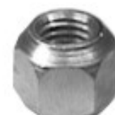
MAQUINADA FORD CHEVY DODGE AUTOS Y PICK UP

H16-305 H16-306L THREAD °2 ROSCA 1/2-20H HEX HEXAGONO: 13/16" HEIGHT ALTURA: 23/32" PAVONADA U/E 300