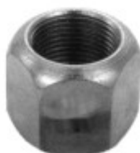
MAQUINADA PARA CAPUCHON

H16-061 H16-062L THREAD °2 ROSCA 1 5/16-16H HEX HEXAGONO: 1 3/4" HEIGHT ALTURA: 1 3/8" PAVONADA U/E 50