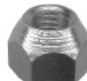
MAQUINADA FORD LOBO

H16-067 THREAD °2 ROSCA 12X1.75 HEX HEXAGONO: 20 MM HEIGHT ALTURA: 13 MM TROPICALIZADA U/E 300