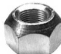
MAQUINADA AGRICOLA INTERNATIONAL

H16-054 THREAD °2 ROSCA 11/16-16H HEX HEXAGONO: 1 1/16" HEIGHT ALTURA: 15/64" GALVANIZADA U/E 100