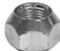
FORJADA CODIGO K TOPAZ CELEBRITY

H16-027 THREAD °2 ROSCA 12X1.50 HEX HEXAGONO: 19 MM HEIGHT ALTURA: 14 MM GALVANIZADA U/E 500