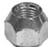
FORJADA CHEVY DODGE NISSAN

H16-025 H16-038L THREAD °2 ROSCA 7/16-20H HEX HEXAGONO: 3/4" HEIGHT ALTURA: 9/16" GALVANIZADA U/E 300