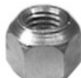
MAQUINADA FORD CHEVY DODGE AUTOS Y PICK UP

H16-005 H16-006L THREAD °2 ROSCA 1/2-20H HEX HEXAGONO: 13/16" HEIGHT ALTURA: 23/32" GALVANIZADA U/E 300