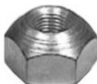
MAQUINADA AGRICOLA FORD MASSEY FERGUSON

H16-019 THREAD °2 ROSCA 1/2-20H HEX HEXAGONO: 1 1/16" HEIGHT ALTURA: 45/64" GALVANIZADA U/E 200