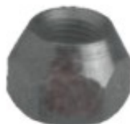
FORJADA NISSAN DATSUN

H16-030 NACIONAL H16-130 IMPORTADA THREAD °2 ROSCA 12X1.25 HEX HEXAGONO: 20 MM HEIGHT ALTURA: 16 MM GALVANIZADA U/E 300