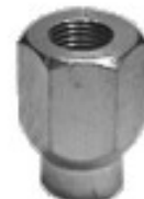
MAQUINADA TUERCA PARA RIN DE MAGNESIO

H16-007 H16-008L THREAD °2 ROSCA 7/16-20H HEX HEXAGONO: 13/16" HEIGHT ALTURA: 1 11/64" GALVANIZADA U/E 300