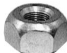
AGRICOLA INDUSTRIAL Y AUTOMOTRIZ

H16-117 FORJADA H16-118L MAQUINADA H16-217 MAQUINADA H16-218L THREAD °2 ROSCA 3/4-16H HEX HEXAGONO: 1 1/4" HEIGHT ALTURA: 7/8" TROPICALIZADA U/E 75