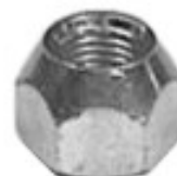
FORJADA CHEVY DODGE NISSAN

H16-032 H16-039L THREAD °2 ROSCA 1/2-20H HEX HEXAGONO: 3/4" HEIGHT ALTURA: 19/16" GALVANIZADA U/E 500